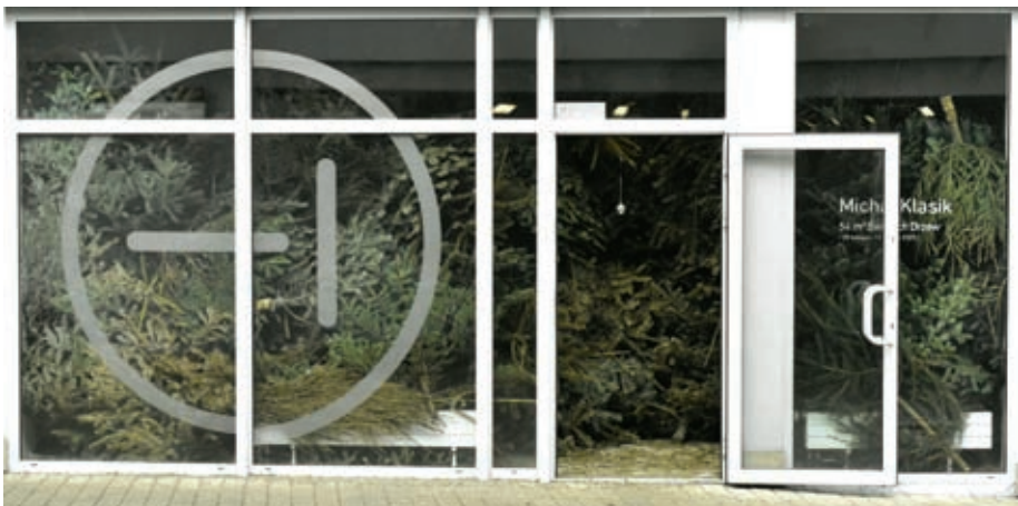
Fotografia 2. 54 m 3 świętych drzew (galeria Minus1.artspace, 2023)