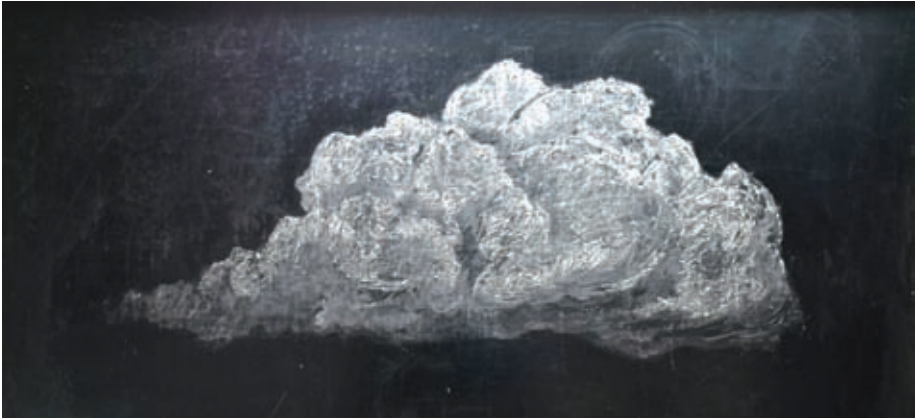
Fotografia 5. Trzy lekcje rysunku – rysunek 2

Drugi temat, jakim jest kwestia gospodarki wodą, pojawił się na tablicy jako wrażliwa, ulotna para wodna w postaci białej chmury (fotografia 5).