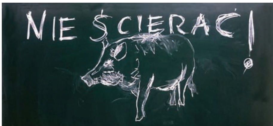
Fotografia 4. Trzy lekcje rysunku – rysunek 1

Wykorzystuję sprawność rysunkową, by przykuć uwagę słuchacza (może powinienem powiedzieć „widza”?), zyskać jego skupienie. Korzystam z niej, ponieważ obraz lubi zagnieździć się w pamięci silniej niż słowo. Obraz połączony z gestem, mową ciała „tańczącego” przy tablicy tym bardziej zapada w pamięci. Architekt i teoretyk Juhani Pallasmaa (2015) opowiada o tysiącach rysunków, jakie wykonał podczas swoich podróży. Dzięki nim i udziałowi ciała (ręki) podczas ich wykonywania do dnia dzisiejszego pamięta w szczegółach konkretne momenty i miejsca, które odwiedzał. Dalej można próbować o czymś opowiadać, wprowadzać narrację. Czasem jest ona niezbędna – szczególnie kiedy staje się przed ludźmi bardzo młodymi. Choć nie należy tłumaczyć tego, na co się patrzy. Trzy lekcje rysunku powstały w wyniku spontanicznej reakcji na przytłaczające fakty, wiadomości, z którymi trzeba było sobie w danym momencie poradzić. Informacje, które nie mogły pozostać w ukryciu. Zamieszczone reprodukcje to rysunki, które powstawały w trakcie lekcji plastyki. Pierwsza z nich to kwestia zwierząt – dzików, które to rzekomo zagrażać miały śmiertelną chorobą masowym hodowłom trzody chlewnej i z tego powodu miały zostać wybite (fotografia 4).