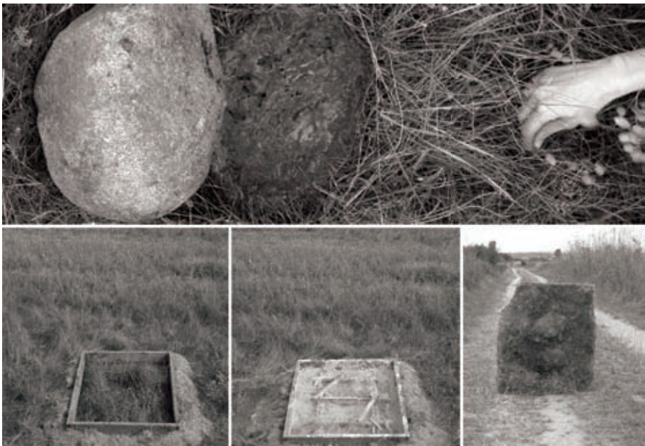
Fotografia 1. Przeniesienie

Przeniesienie to działanie w pejzażu wsi okalających Centrum Rzeźby Polskiej w Orońsku. Jest zapisem relacji: człowiek – pejzaż, artysta i jego działanie. Praca polegała na zabraniu z pejzażu kamienia i dokumentacji tego wydarzenia poprzez odlanie pustego miejsca w ziemi, po kamieniu, gipsową formą oraz sfotografowaniu całego procesu.