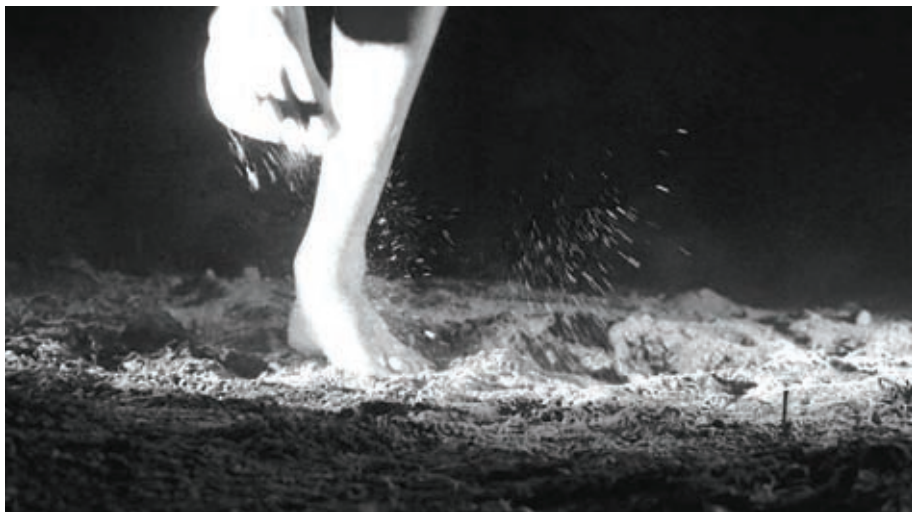
Fotografia 3. Pierwszy człowiek w kosmosie (kadr z wideo performance)