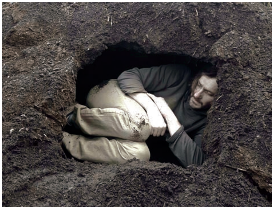
Fotografia 9. W Ziemi