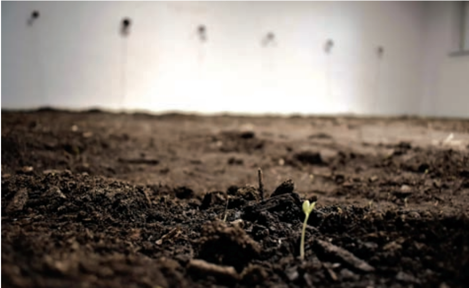
Fotografia 8. Mimo negocjacji nie udało się osiągnąć zawieszenia broni (instalacja, Galeria Uniwersytecka w Cieszynie, 2022)