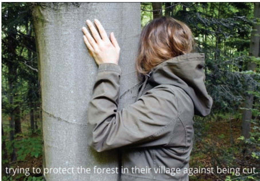
Fotografia 4. tree-hugger (performance dokamerowy, 2021)

Określenie „tree-huggers” w języku angielskim oznacza nie tylko osoby, które lubią przytulać się do drzew, ale przede wszystkim osoby, które stają w obronie przyrody.