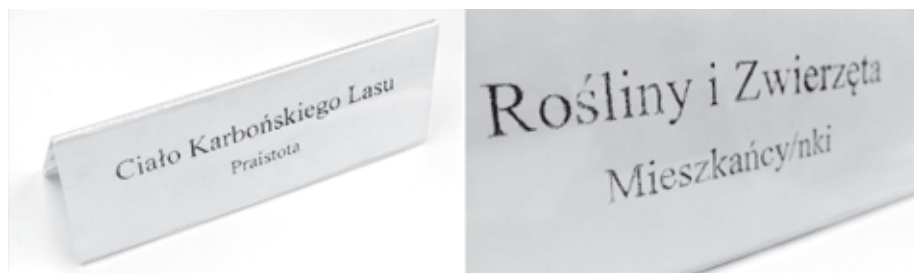
Fotografia 7. Zwracam Ci imię (obiekty rysunkowe, 2023)

Przeglądając publikowane w tamtym czasie artykuły i towarzyszące im zdjęcia, można zauważyć, że na zdecydowanej większości fotografii widnieją głównie mężczyźni usadowieni za konferencyjnymi stołami. Przed każdym z nich ustawione są wizytówki z imionami i pełnią funkcję – prezes, dyrektor, wojewoda itd. To oni mają ten realny, słyszalny głos i słyszą też jedynie swoje głosy. Dlatego wykonałam dwa niewielkie obiekty rysunkowe, które symbolicznie włączają do dyskusji przyrodę ożywioną i nieożywioną – rośliny i zwierzęta oraz właśnie sam węgiel, z którego chciałam „zdjąć” imię nadane mu w celu zaznaczenia jego posiadania (Paruszowiec pochodzi od męskiego imienia Parus, należącego do prawdopodobnego założyciela miejscowości, w której mieści się pokład). Próbowałam nazwać go na nowo, stwarzając relację wolną od eksploatacji – stąd imię „Ciało Karbońskiego Lasu – Praistota”. Silną inspiracją były dla mnie wszelkie kultury rdzennych plemion, wyrażające w swoich językach – sposobie opisywania, a co za tym idzie i postrzegania świata – świadomość połączenia z naturą. Motywował mnie również fakt, że w systemach zdominowanych przez patriarchyat występuje nieprzypadkowe połączenie pomiędzy brakiem głosu przyznawanego kobietom i właśnie przyrodzie.