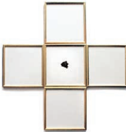
Fotografia 1. grudka Ziemi (2018)

Jedną z pierwszych prac wykonanych w ramach „sekretnego aktywizmu” był obiekt rysunkowy grudka Ziemi (2018), któremu towarzyszyły słowa: „Narysowałam grudkę Ziemi i oprawiłam w ramki w kształcie równoramiennego krzyża, myśląc o tym, jak inaczej wyglądałby świat, gdyby Ziemia była naszą religią”.