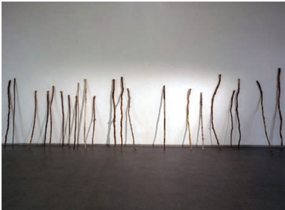
Fotografia 2. kije wędrowne (Galerie FaVU, Brno, 2019)

W trakcie kolejnych wystaw – w Galerie FaVU (Brno, 2019) i Tromsø Kunstforening (2020) – grudce Ziemi towarzyszył zbiór kijów wędrownych pozostawionych po moich pieszych wędrówkach – symboli powolnego, uważnego bycia w świecie, minimalizowania swojego śladu.