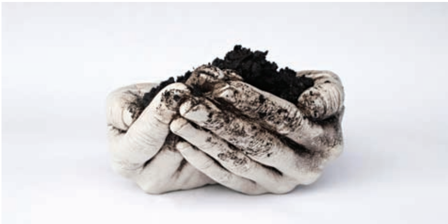
Fotografia 8. Popatrz (obiekt – odlew dłoni artystki i ziemia/Ziemia, 2023)

Jak wiele osób dzisiaj nie ufam zapewnieniom, że przyroda „sama się odrodzi”, „poradzi sobie” – żyjemy w czasach szóstego masowego wymierania gatunków – przyroda, jaką znamy czy znali nasi przodkowie/przodkinie, znika, nie radzi sobie sama, a my mamy więcej niż szansę zniknąć wraz z nią. Dlatego tak bardzo fauna i flora potrzebują swojej reprezentacji. Efektywność tej reprezentacji zwiększa się proporcjonalnie do liczby współpracujących ze sobą osób/istot. W związku z tym mam nadzieję, że tekst ten, poza przedstawieniem własnych badań, stanie się realnym zaproszeniem do współpracy w ramach sekretnego aktywizmu. Tej symbolicznej – utwierdzając osoby czytające ten artykuł w konkretnej postawie, dodając odwagi do działania na rzecz wspólnoty ludzko-nie-ludzkiej, ale i do współpracy bezpośredniej – uwzględniającej rzeczywistą wymianę poszukiwań, współdziałanie, realny kontakt 1 . Ponieważ wierzę w Ziemię, we współodczuwanie i (mimo wszystko) w człowieka.