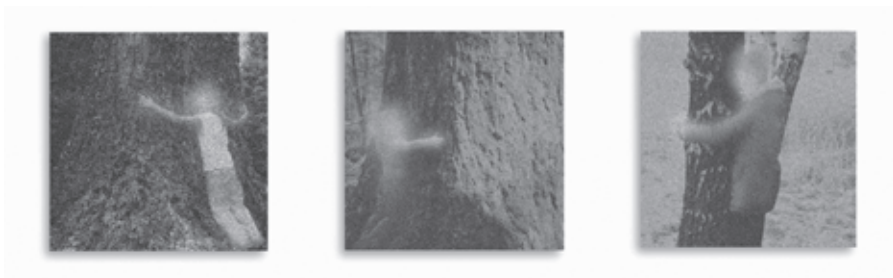
Fotografia 5. tree-huggers (fragment, cykl prac, 2021–2023)